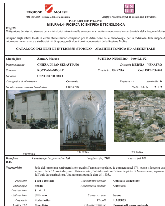
Fig.4.1.3.3 – Chiesa di S.Sebastiano